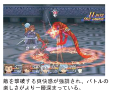
敵を撃破する爽快感が強調され、バトルの楽しさがより一層深まっている。

冒険中に、ひときわ目を引くのが戦闘シーンでのアクションの豊富さ。3D画面特有のわずらわしさは無く従来のバトルシステムのように遊べる。バトルフィールド上には敵と自分を結ぶ複数のラインが設定されており、自分が戦いたい敵にカーソルを合わせるだけで、素早く目標を攻撃出来る。