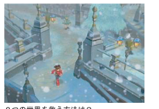
2つの世界を救う方法は?

破滅の危機が迫る世界「シルヴァラント」を救うため、ロイドは仲間とともに旅立った。しかし世界を救うことは、逆世界「テセアラ」が崩壊することを意味していた。自分の世界を救えば、もう1つの世界が犠牲になる…。2つの世界を救う方法を求め、ロイドの果てしない冒険が始まる。